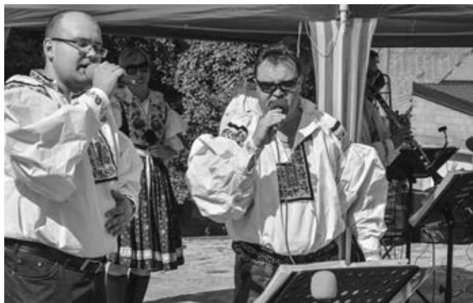
Dechová hudba Vlčňovjané při hodovém odpoledni v amfiteátru