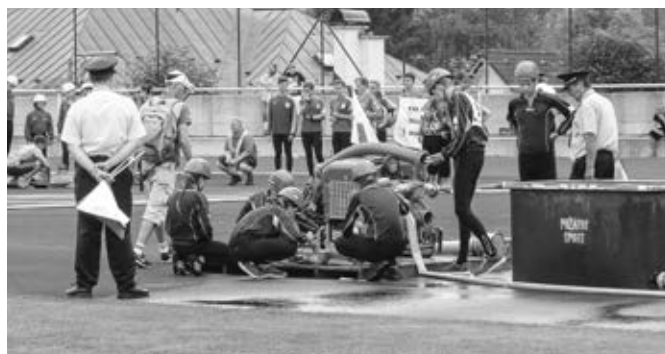
Naši žáci v přípravě na požární útok