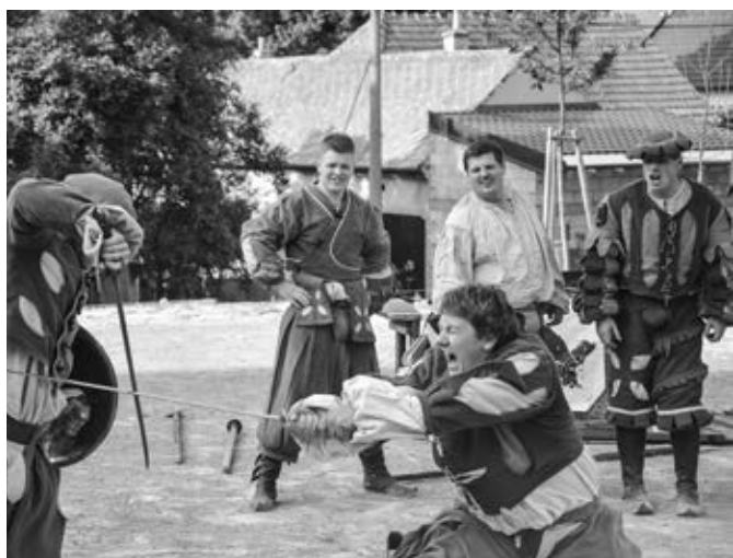
Memento mori v amfiteátru