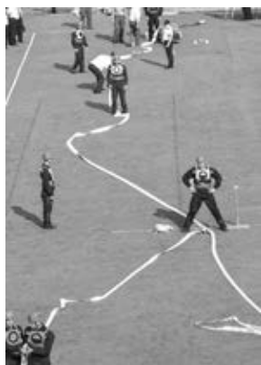
Tým M1 dokončil požární útok CTIF – kontrola rozhodčích – zlaté ocenění