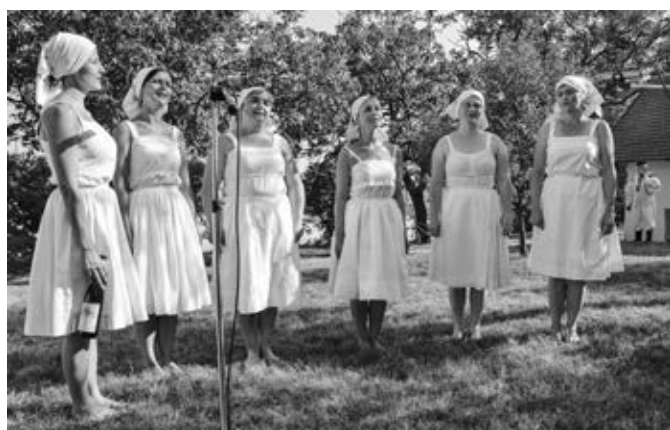
Vlčňovské búdové umělkyně