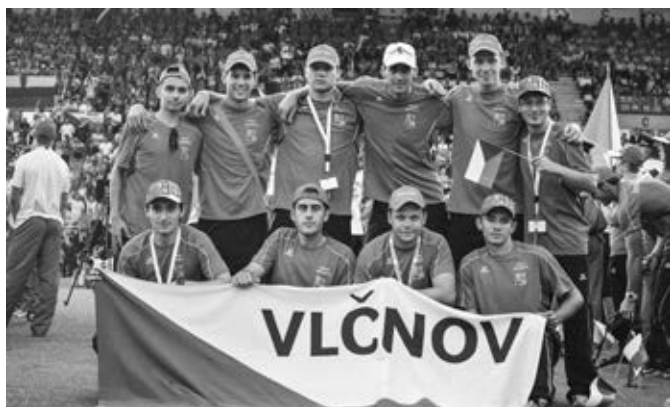
Slavnostní vyhlášení výsledků a ukončení olympiády – tým M2 (bronzové ocenění)