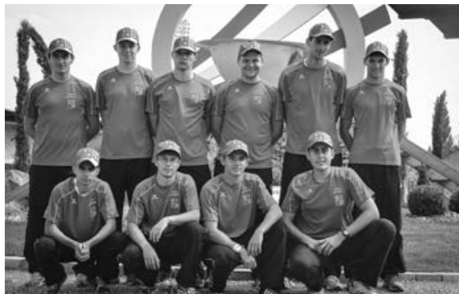
Tým M2 v prostoru před olympijským ohněm