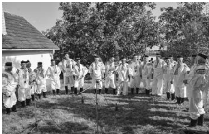
Mužský sbor Vlčňov při hodovém zpívání v búdách