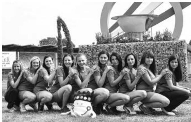
Náš tým žen v prostoru před olympijským ohněm