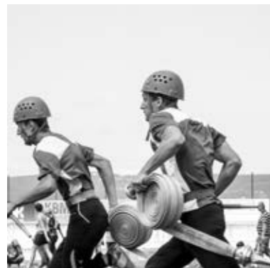
Naši proudaři při požárním útoku