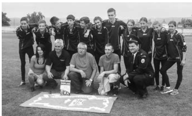
Úspěšní žáci i se svými vedoucími

Přesto po polovině disciplín byl Vlčnov v celkovém součtu v dosahu medailí, ale přílišná euforie nebyla na místě. Byli jsme si vědomi, že poslední soutěžní den (pátek) budou ještě tři velmi těžké disciplíny, ve kterých jsme zrovna vysoké ambice neměli. Ovšem hned v té čtvrté, štafetě dvojic, se naplnilo známé přísloví hovořící o tom, že výjimka potvrzuje pravidlo. Naši dosáhli krásný čas 48,98 sekund, který ale vzhledem k opět velké vyrovnanosti týmů stačil „jen“ na šesté místo. V následné disciplíně, ve štafetě 4×60 metrů s překážkami