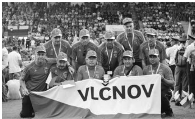
Slavnostní vyhlášení výsledků a ukončení olympiády – tým M3 (stříbrné ocenění)