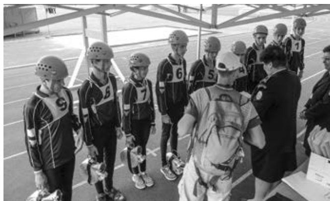
Kontrola totožnosti před PÚ CTIF