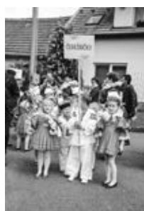
Čerešničky v průvodu