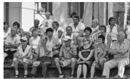
Hodové odpoledne v amfiteátru