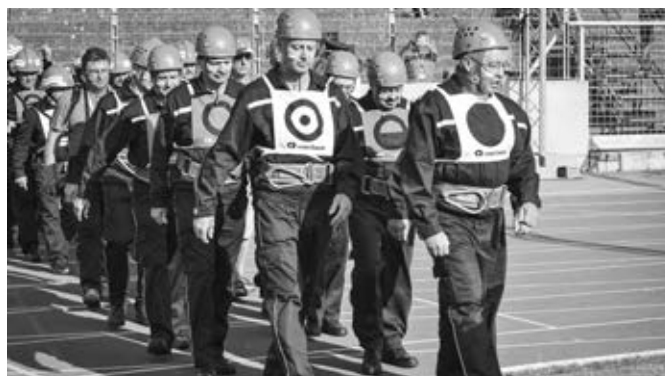
Tým M3 nastupuje na plochu olympijského stadionu v prvním sledu