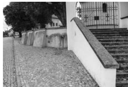
Vydlážděný prostor kolem kostela