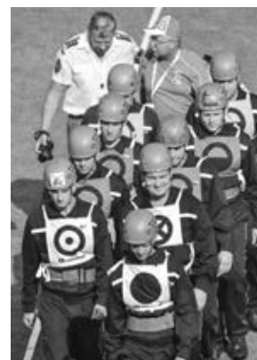
Spokojený tým M1 přechází z požárního útoku na štafetu CTIF – zlaté ocenění