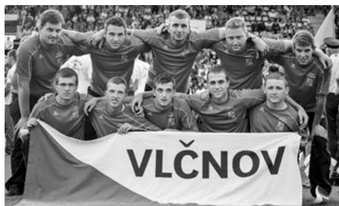
Slavnostní vyhlášení výsledků a ukončení olympiády – tým M1 (zlaté ocenění)