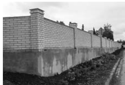
Rekonstrukce hřbitovní zidky