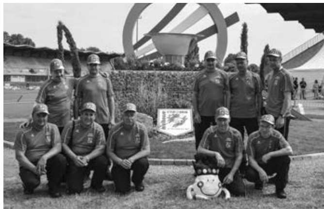
Tým M3 v prostoru před olympijským ohněm