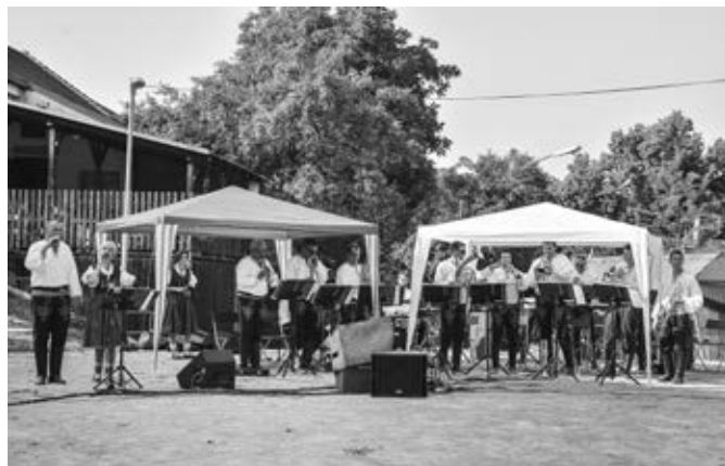
Hodové odpoledne v amfiteátru