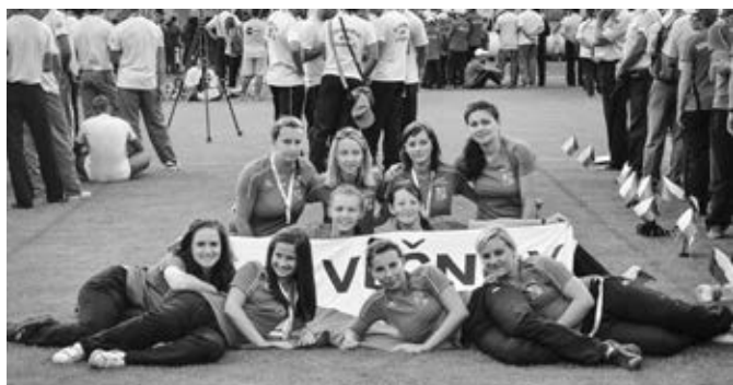
Slavnostní vyhlášení výsledků a ukončení olympiády – tým žen (bronzové ocenění)