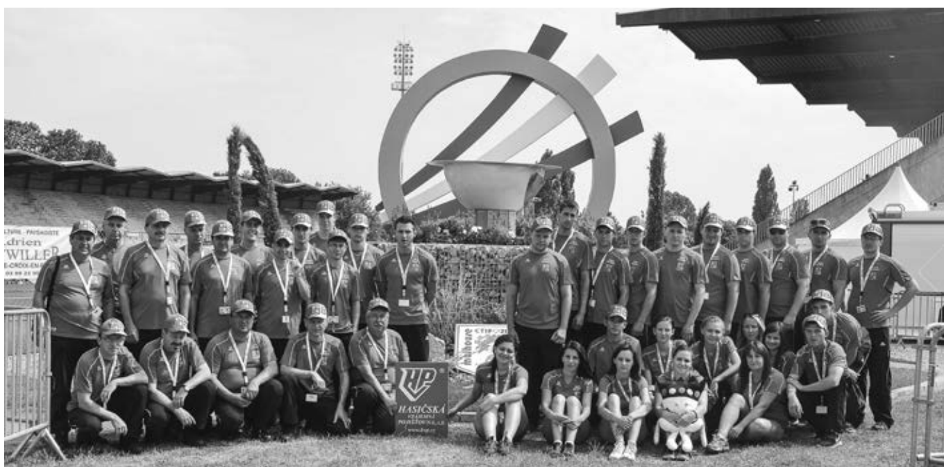
Všechny vlčnovské týmy v prostoru před olympijským ohněm

V požárním sportu se do bojů o olympijské kovy pustilo 9 družstev profesionálních hasičů, 8 dobrovolných a 9 žen. Česká republika byla zastoupena 6 družstvy – 1 profesio-