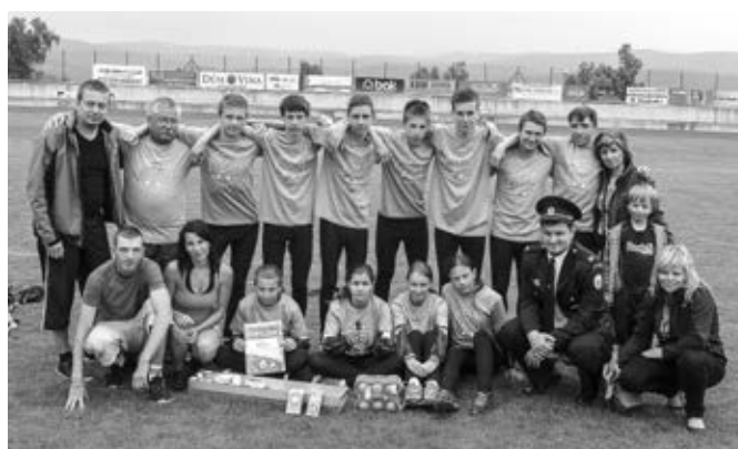
Celá vlčnovská výprava v Jablonci – žáci, vedoucí a fanoušci