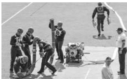
Tým M2 při vytváření sacího a dopravního vedení požárního útoku CTIF