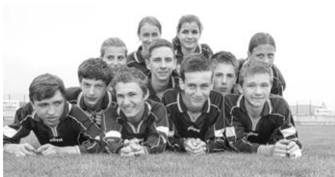
Na závěr náročného mistrovství vlčnovská živá pyramida