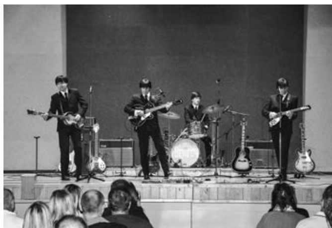
Beatles revival v KSK