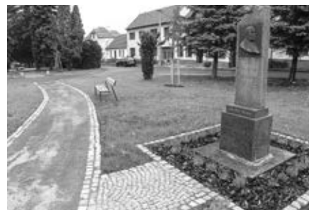
Úprava parku pod sokolovnou