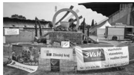
Loga některých našich sponzorů v prostoru před olympijským ohněm