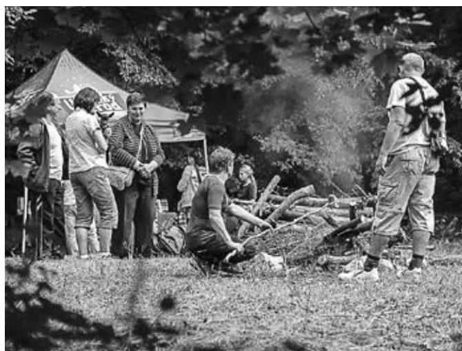
Setkání na Pepčíně