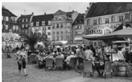
Noční Mulhouse v historické části města, před radnicí