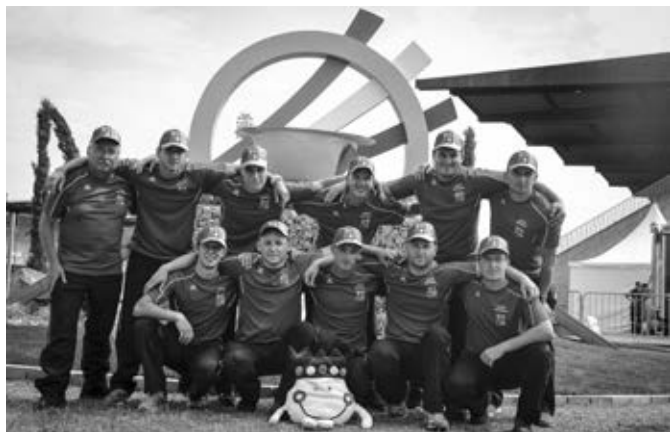
Tým M1 v prostoru před olympijským ohněm

Naše dvojčeka rovněž dosáhla „jen“ na bronzové ocenění. U tohoto mladého kolektivu mě to osobně přišlo jako velmi nespravedlivé. Pokud totiž v těžkých přípravných dobách na olympiádu (a že jich bylo) jsem se opravdu mohl na někoho vždy spolehnout, tak to byl právě tento mladý tým. Poctivě trénoval, pomáhal ochotně ve věcech sborových. V závěru přípravy ve Vlčnově se prezentoval poměrně často časy pod 40 sekund, někdy dokonce okolo 38 sekund, což jsou již výsledky atakující směle zlatou skupinu. No a vidíte, na vrcholné sportovní události „dostali“ 30 trestných sekund za rozpojené útočné vedení a nesprávnou práci. Velká škoda, toto si chlapci určitě nezasloužili. Bohužel a nebo bohudík, ale ve sportu se na zásluhy nehraje. Krásnou a rychlou štafetou potvrdili smutnou skuteč-