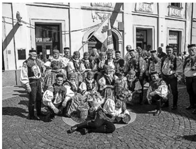
Slavnosti vína v Uh. Hradišti - účastníci z Vlčnova