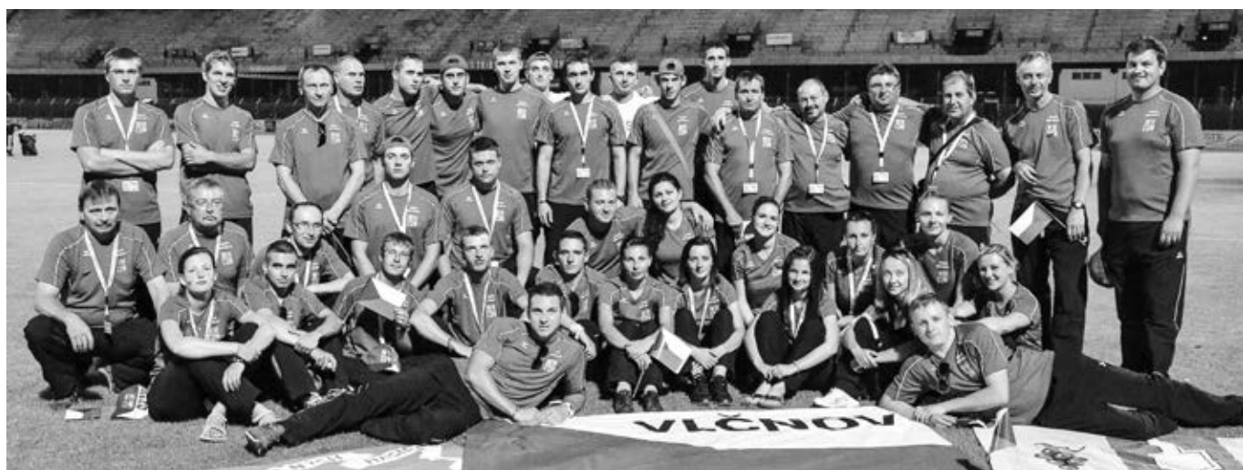
Vlčnovské týmy na olympiádě v Mulhouse po ukončení – M1, M2, M3 a Ženy