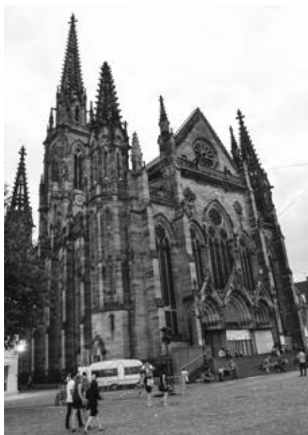
Mulhouse s dominantou katedrálou