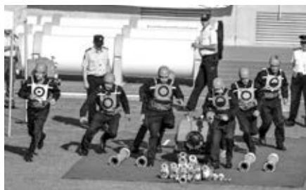
Začátek požárního útoku CTIF týmu M3 na olympiádě