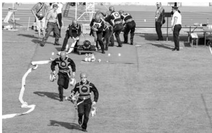
Začátek požárního útoku CTIF týmu M1