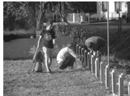
Spolek přátel Plotácka při rekonstrukci hřiště