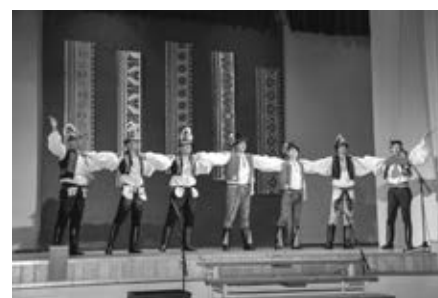
Páteční večer patřil verbířům