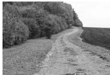
Úprava polní cesty k Boří