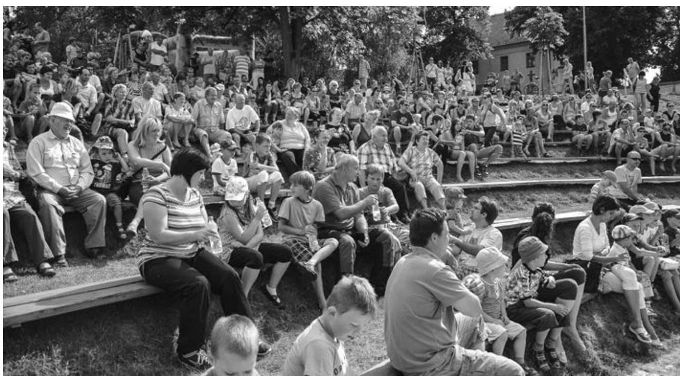
Šermířské odpoledne přilákalo do amfiteátru děti i dospělé