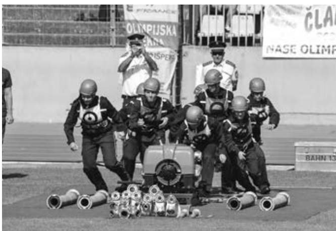
Začátek požárního útoku CTIF našich žen na olympiádě