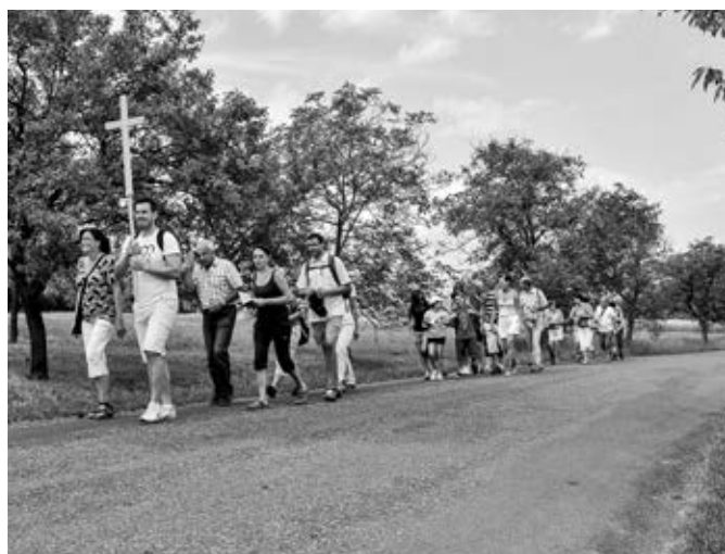
Pěší pouť k sv. Antonínkovi na Blatnickou horu