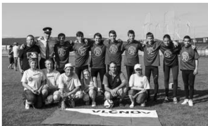
Celá vlčnovská výprava – dorostenci, vedoucí a fanoušci