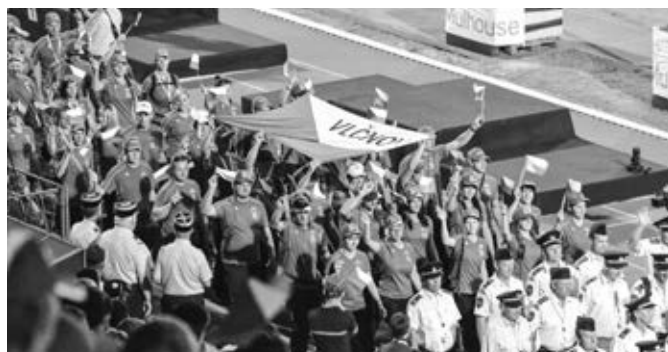
Ukončení olympiády v Mulhouse – SDH Vlčnov součástí výpravy České republiky