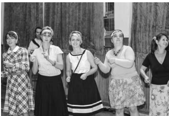
Úspěšné vystoupení skupiny Beatles revival doprovázely účastnice v dobovém oblečení