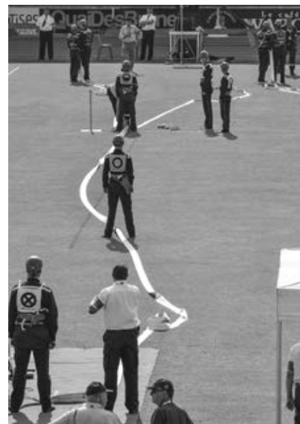
Tým M2 po dokončení požárního útoku CTIF – kontrola rozhodčích