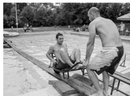
Obnovená úspěšná akce na koupališti „Suchou nohou“