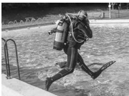
Potápěči na koupališti