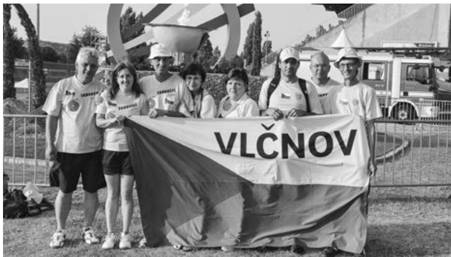
Vlčnovští fanoušci před olympijským ohněm