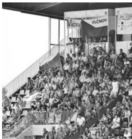
Vlčnovští fanoušci (světlá trička) v části olympijské tribuny, která patřila fanouškům České republiky