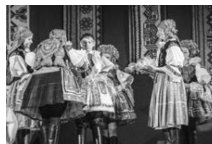
Předání vlády králů v Klubu sportu a kultury