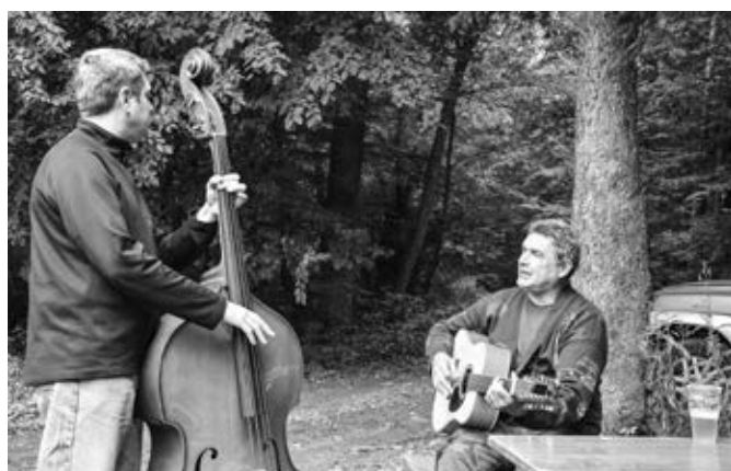
Setkání na Pepčíně při country