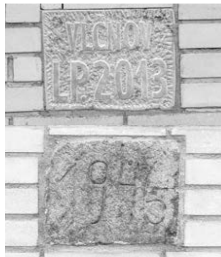
Nový a původní letopočet hřbitovní zidky