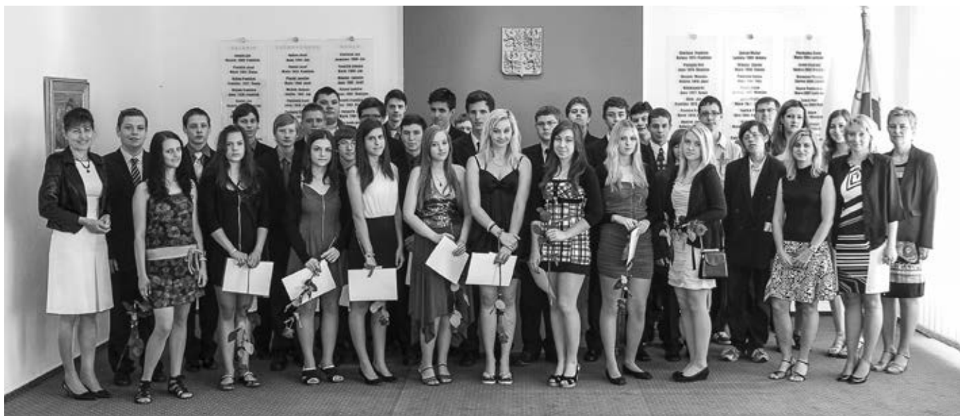
Přijetí žáků 9. tříd v obřadní síni