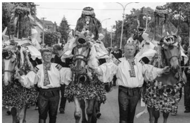
Král jízdy králů 2013 s pobočníky