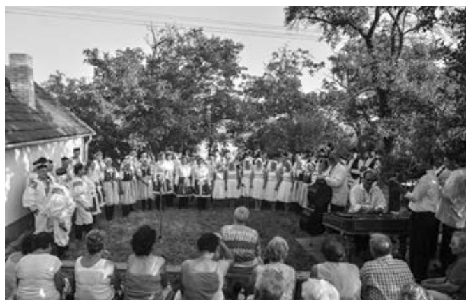
Všichni účastníci hodového zpívání v búdách