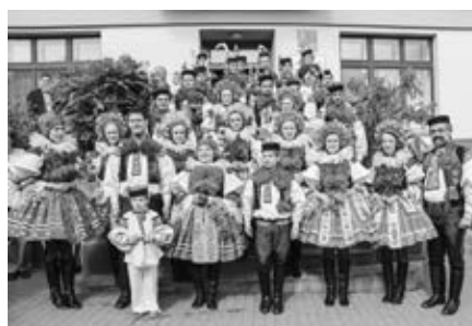
Přijetí královské družiny a děvčat z ročníku starostou