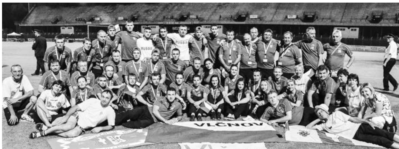
Téměř celá vlčnovská výprava na olympiádě v Mulhouse – závodníci, fanoušci