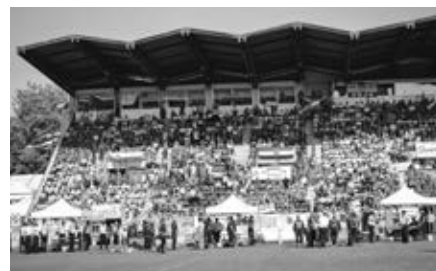
Bouřlivá atmosféra na tribuně