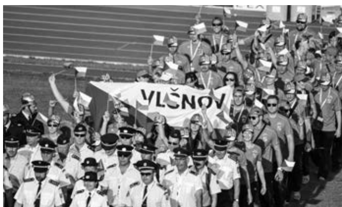
Slavnostní zahájení olympiády v Mulhouse – nástup výpravy České republiky